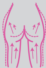
Inestetismi della cellulite